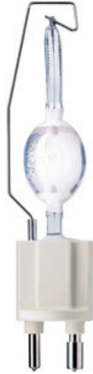
MHN-SE 2000W 400V /956 Philips 928778