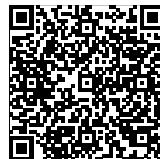
Photo non contractuelle