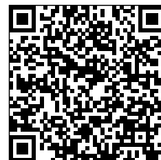
Photo non contractuelle