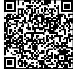
Photo non contractuelle