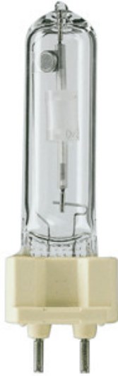
HSD 150/70 G12 OSRAM