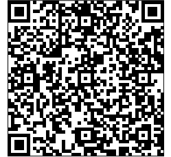
Photo non contractuelle