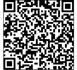
Photo non contractuelle