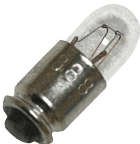
T1 3/4 Midget Grooved 14V 80mA 386