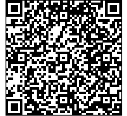
Photo non contractuelle