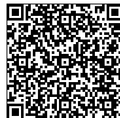
Photo non contractuelle