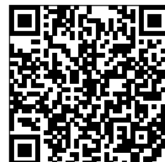
Photo non contractuelle