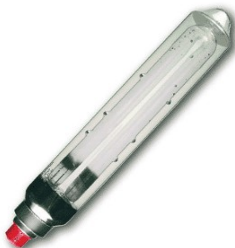
BY22D Sox 55w 1800K SPL (sodium)