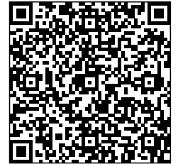
Photo non contractuelle