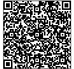
Photo non contractuelle