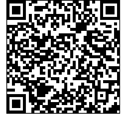
Photo non contractuelle