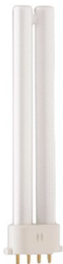
2G7 CFL S/E 7W /830 4 pins