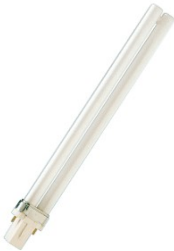
G23 CFL S 11w /830 2 pins