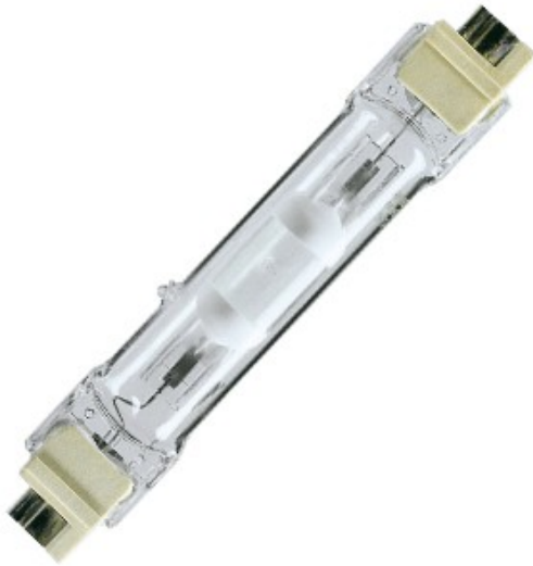
FC2 IM 250w /842 4200K