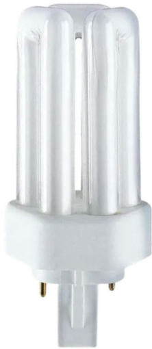
GX24D1 CFL T 13w /830 2 pins