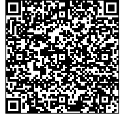
Photo non contractuelle