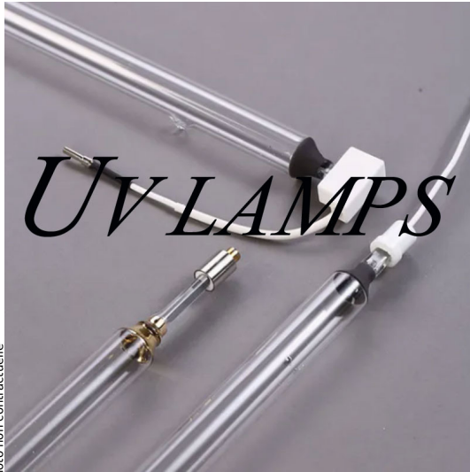
Lampe Benford (PM2423 PRIMARC) 925mm