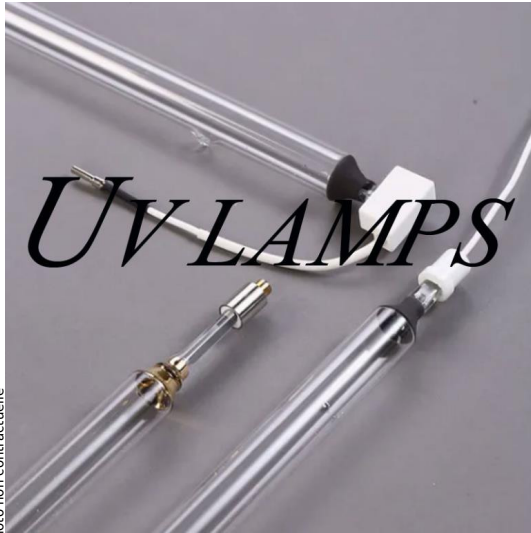
Lampe Benford (PM1208 PRIMARC) 897mm