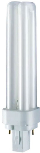
G24D3 CFL C 26w /830 2 pins