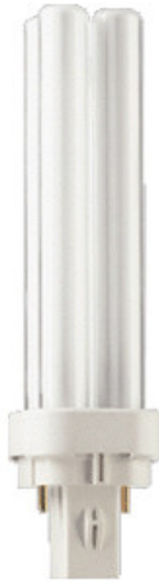
G24D3 CFL C 26w /830 2 pins