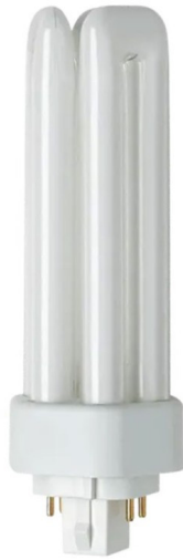
G24Q1 CFL C/E 13w /827 4 pins