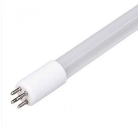
Lampe UVC B160VIK 160w 853mm