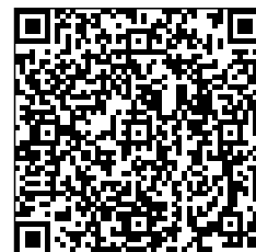
Photo non contractuelle